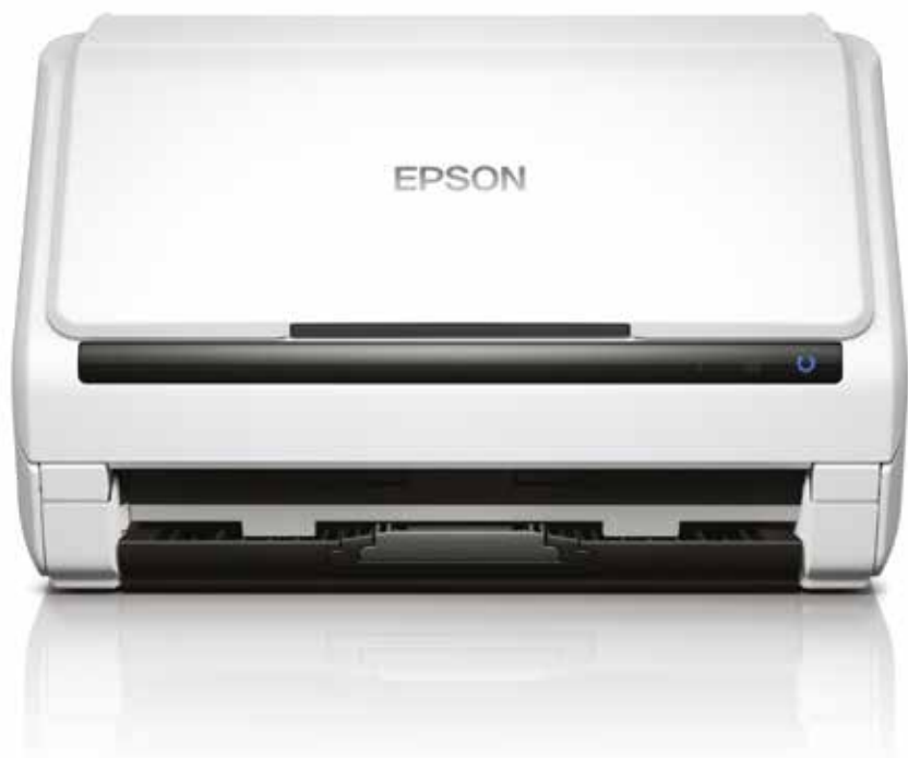
Scansione in A3: 1 - La scansione di supporti A3 utilizza un foglio di supporto scansione

Gli scanner documentali a colori con funzionalità fronte/retro WorkForce DS-530 e DS-570W sono la scelta ideale per gestire i documenti aziendali, in quanto permettono di acquisire, catalogare, salvare e condividere i documenti più importanti in modo rapido.